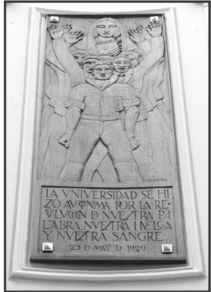
Palacio de la Autonomía UNAM