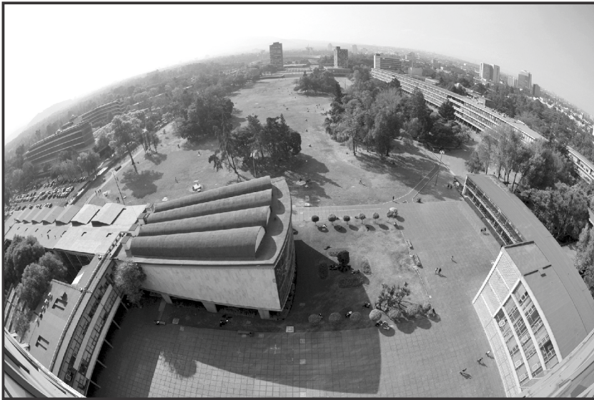
Panorámica Campus Universitario