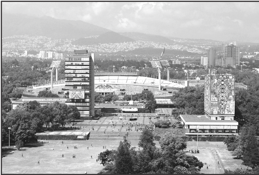
Panorámica Campus Universitario