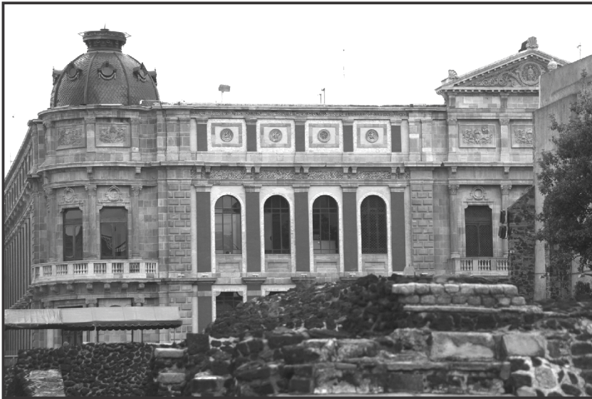
Palacio de la Autonomía UNAM