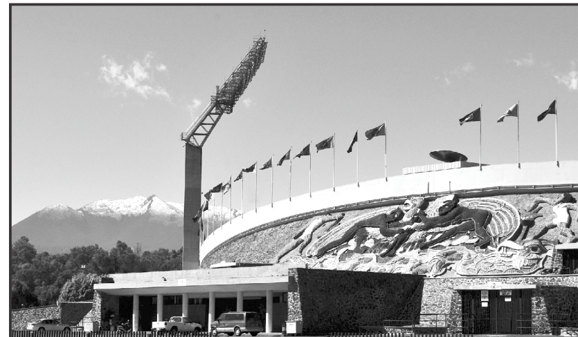
Estadio Olímpico Universitario

Kant, I., (1999) Fundamentación de la Metafísica de las Costumbres , Barcelona: Ariel. Recursos en línea Ley orgánica de la UNAM , disponible en línea, http://publicaciones.anuies.mx/revista/31/2/3/es/3-ley-organica-de-la-universidad-nacional-autonoma-de-mexico-1945 [última consulta 1 de marzo, 19:20 horas]